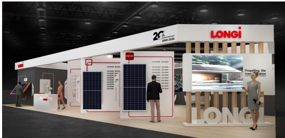
ブースイメージ (デザインは予告なく変わることがあります)

展示会名 「スマートエネルギーWeek 2020」内 「第13回 [国際] 太陽光発電展 (PV EXPO 2020)」